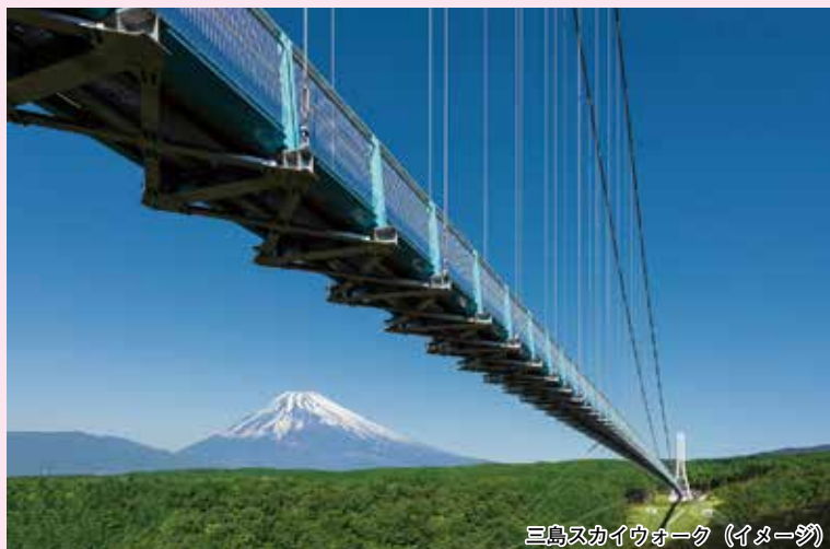
三島スカイウォーク(イメージ)