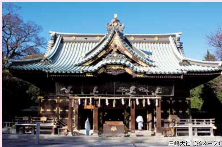
三嶋大社(イメージ)